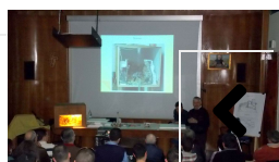
Continua a Cristo Re il corso di Arte Presepiale 2014