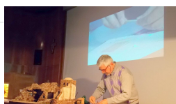
Messina, corso di "Arte Presepiale" nella Chiesa di Santa Maria di Portosalvo