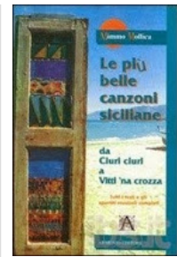
Da Ciuri Ciuri a Vitti 'na crozza